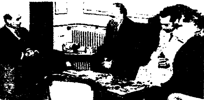
الدكتور العطار يولي بغيره الوزير بطرس استقبل الوفد البلغاري